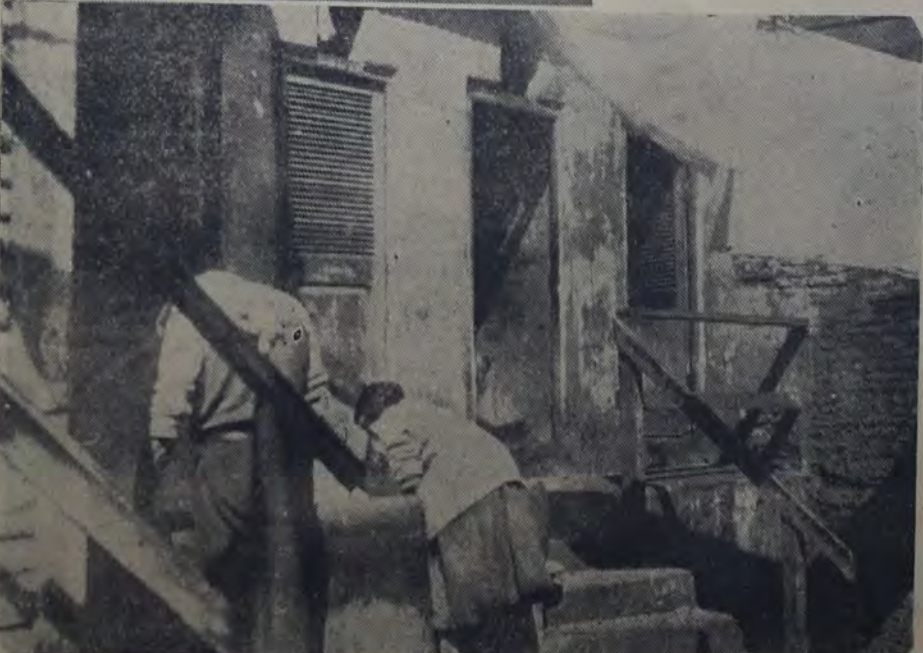
UN ASPECTO DE LA SECCION BAROS ARRIBA: EL SORDIDO PASAJE.