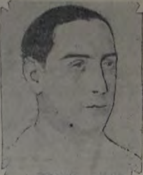
JIMENEZ DE ASUA

Quando un país está ayuno de libertad no puede trazarse un programa político con la hipótesis de lo inexistente, so pena de transformar la empresa de realidades y la apetencia de poder que toda política supone, en un artículo intelectualista o en unas páginas de tratado teórico.